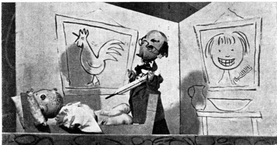
Scenă din „Păjanii lui Hoinărici“ de Joseph Pehr, din spectacolul „Ala bala portocala“.

Din păcate, cele patru scenele alese nu sînt toate la fel de reușite. Spre exemplu, în Baia măgărușului acțiunea nu pledează prin vreun fapt concret pentru necesitatea curățeniei, așa că, în fond, această concluzie abia se întrezărește din țesătura subiectului (doar în final, măgărușul este „pedepsit“ cu spălatul, pentru zburdălni-