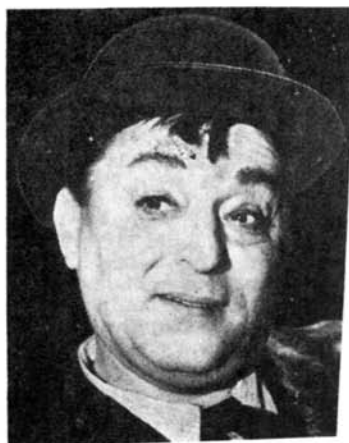
FLORIN SCĂRLĂTESCU Artist emerit