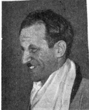
ȘTEFAN MIHAILESCU-BRAILA Artist emerit