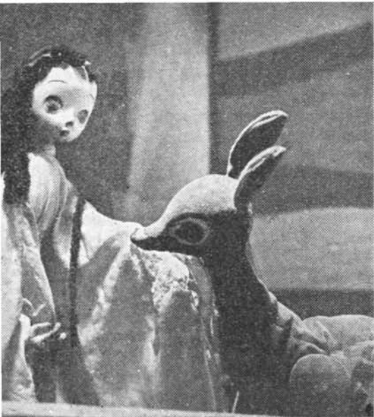
Albă ca zăpada și căprioara

oglindea nu mi s-a părut că a fost rezolvată prea fericit). Și, fără doar și poate, trebuie vorbit despre marșul celor șapte pitici care pleacă și vin purtând lampioane și tirnăcoape, cîntînd — spre neîntîmîriță