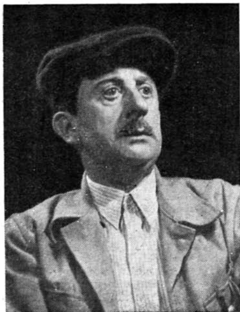
În Spiridon Biserică din „Mielul turbat“ de Aurel Baranga