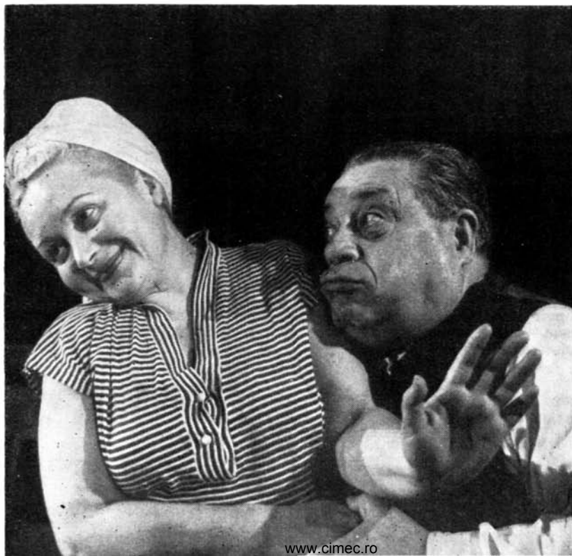
SPIRU : Mă, Florică năzuroasă. FLORICA : Zău, domnu' Stamate, pică Chirilă și dă peste noi.

BÎRSAN : Nici vorbă de asta. M-am referit la... perceptorul dumitale. Dacă-