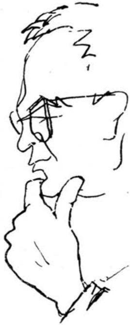
Dramaturgul sovietic Mihail Șatrov

centrala de la Krasnoiarsk. Bineînțeles, mai erau și alte lucruri pe care le discutam cu dînsa. Mă întorceam serile tîrziu acasă. Mama mă certa. Îi era să nu cad cumva la examene... Se întîmplă însă dimpotrivă: acumă îmi venea mult mai ușor să învăț decît înainte.