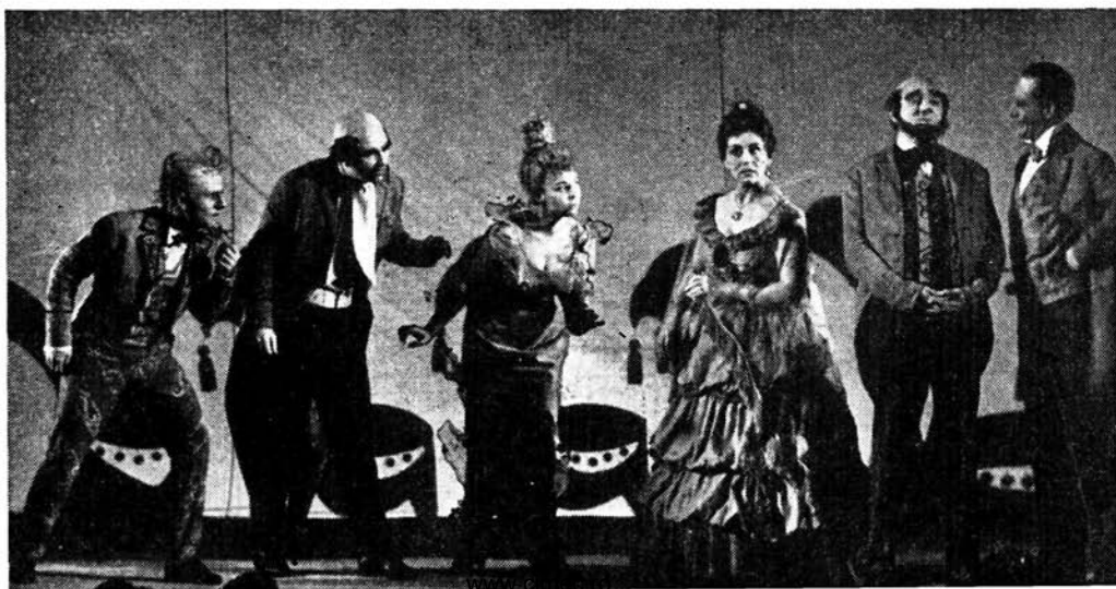
Doou scene din „Millo director”

Pristanda — slugă docilă și care trăiește în speranța de a deveni agă ; Nae și Luxița — cuplu de prostie răsfățat de huzur și viciat pînă în măduva oaselor de o existență parazitară ; Serviescu — întrupare credincioasă a servilismului ; Ciupici — rudă foarte îndepărtată a lui Cațavencu — omul tuturor trădărilor și al tuturor compromisurilor, constituie laolaltă efigiile unui regim pe care mai târziu Caragiale îl va dezvălui cu forța geniului. Toate aceste personaje, surprinse în lașițiile și în micimile lor abjecte de un observator just și de un psiholog clarvăzător, sînt ridiculizate cu o veselie nestînsă. Dar această veselie este a unui dramaturg cu o concepție activă și educativă a scrisului, care-și poartă personajele prin situații comice și lasă replicile să se rosto-