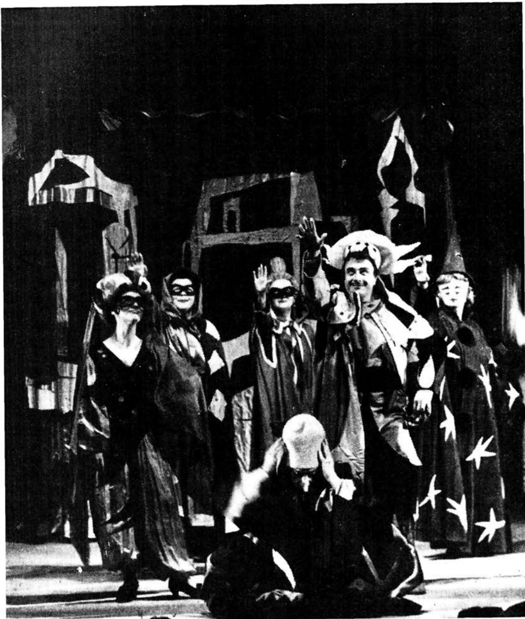
Scenă din „Iașii-n carnaval”