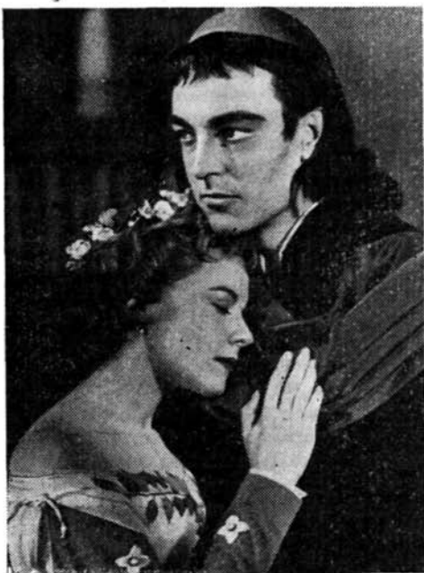
Dorothy Tutin și Richard Johnson în rolurile titulare din „Romeo și Julieta” de Shakespeare — Teatrul Memorial Shakespeare din Stratford-pe-Avon