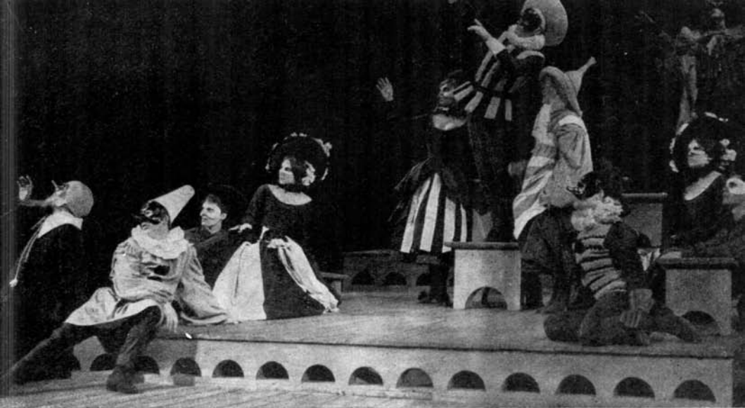
Intermezzo în spiritul comediei dell'arte în spectacolul cu Comedia erorilor

cherche pour une faim" — World Premières Mondiales — februarie 1962).