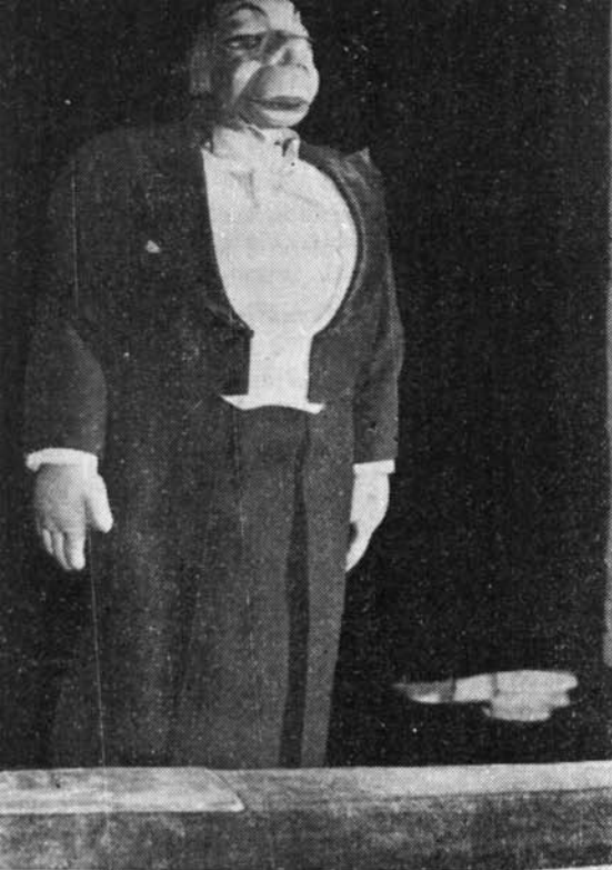
Comperul din „Concertul neobișnuit“

să cuprindă toate octavele instrumentului și să „ia“ acordurile largi, specifice muzicii lui Liszt. Țincul, bineînțeles, nu poate face nimic din toate acestea, ele rămânând în sarcina (o fi vreo insinuaire?) altui pianist, din culise.