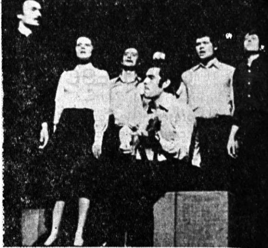
Studentii Facultății de construcții civile, pe scena Festivalului

La începutul lunii aprilie s-a desfășurat, în Capitală, etapa pe Centrul Universitar București a Festivalului național „Cîntarea României”, întrucît participarea formațiilor artistice studentești plasate pe primele locuri în faza de masă.