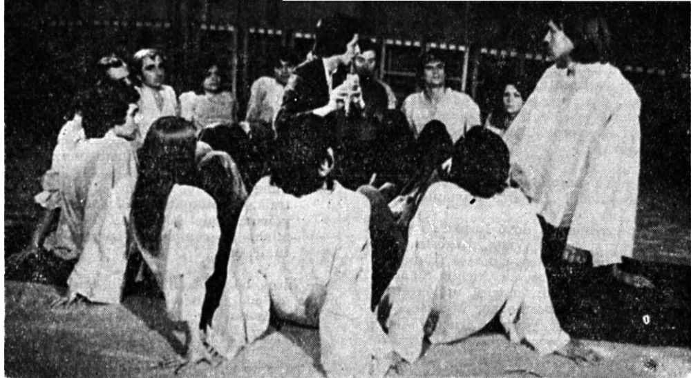
Montajul „Simbol pentru independență“, în interpretarea teatrului studențesc „Podul“

substanțială la reușita Festivalului, montajele realizate de Institutul de arhitectură, de Facultatea de tehnologia construcțiilor de mașini de la Institutul Politehnic București, de Conservatorul „Ciprian Porumbescu“, de Facultatea de finanțe-contabilitate.