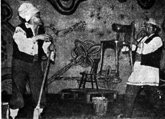
Casa de cultură Călimănești: „Ediție specială cu Păcală și Tindală” de Mihai Ispirescu

sînt interesați de ceea ce vîd în sala Casei de cultură, ci ar trebui să aibă și conștiința că cineva, anume, se îngrijește cu toată străduința de acest bun mers al lucrurilor.