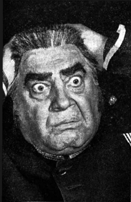
Sus, in „Revizorul“ de Gogol. Jos, in „Bădăranii“ de Goldoni. Dreapta, sus, Ștefan Trahanache din „O scrisoare pierdută“ de I. L. Caragiale; jos, in „Enigma Otiliei“, dramatizare după George Călinescu