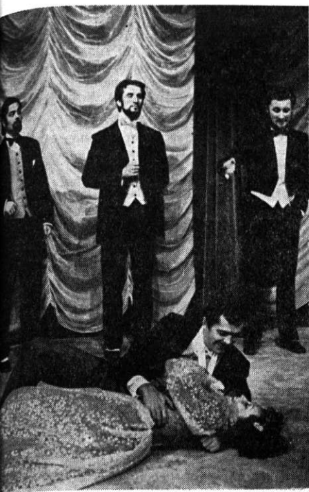
INSTITUTUL DE TEATRU „SZENTGYÖRGYI ISTVAN“ DIN TIRGU MURES