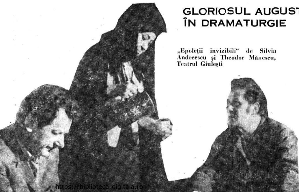
„Epoleții invizibili“ de Silvia Andreescu și Theodor Mănescu, Teatrul Giulești