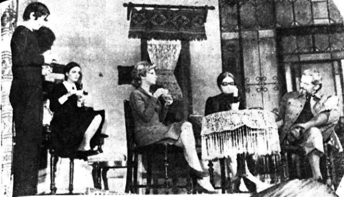
„Surorile Boga” de Horia Lovinescu, Teatrul Națio- ← nal din București