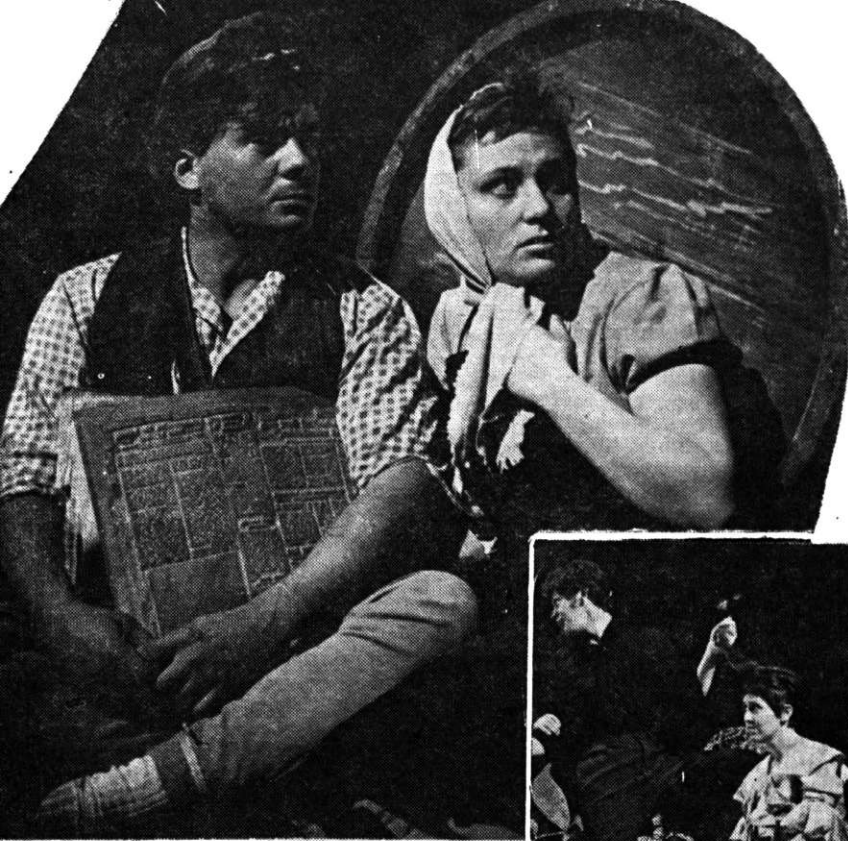
„Marele fluviu își adună apele“ ↑ de Dan Tărchilă, Teatrul Mic.