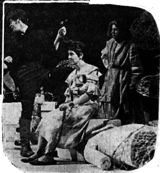
„Piticul din grădina de vară“ de D. R. Popescu, Teatrul Maghiar de Stat din Cluj- Napoca →