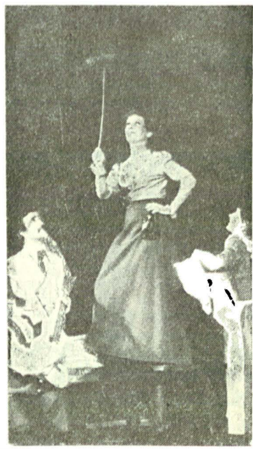
BOCET VESEL PENTRU UN FIR DE PRAF RĂTĂCITOR de Sütő András, Teatrul Național din Tîrgu Mureș, secția maghiară

Îmi pare un spectacol complex, reunind în el clasicism și modernitate, realism și poezie, adevăr literar și adevăr scenic, aspecte comice și aspecte tragice ale vieții. Există o partitură Cehov — așa cum în dramaturgia noastră există o partitură Caragiale — deschisă oricând unor diferite „citiri” și „recitiri” interpretative, dar tot atât de hotărâtă și în a-și păstra un sens al ei, adică, tradițional. Sănotese că spectacolul la care mă refer a găsit mijloace ca, între aceste ipostaze, aparent contradictorii, să funcționeze modalități, de armonizare și de integrare.