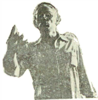
SUFLETE TARI de Camil Petrescu, la teatrul TV.

De ce nu?... deși, pentru asta, va trebui să devansăm premiera cu cel puțin o lună. O versiune telegenică, deci, pe care regizorul Cornel Todea o gindește în imagini de o expresivitate modernă, avîndu-i printre colaboratori pe Valeria Seciu și Mircea Albulescu.