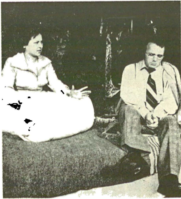
CUM S-A FĂCUT DE-A RAMAS CATINCA FATA BATRINA de Nelu Ionescu la Teatrul Național „Vasile Alecsandri” din Iași.

Un fluxiu de poezie, în revărsarea lui tumultuoasă spre mare, lasă pe mal (pe scenă) o legătură de stuf, în misterioasă vibrație (regia, Dan Nasta).