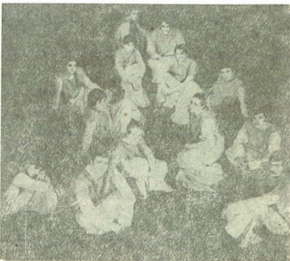
„Sîngeroasa mascaradă”, scenariu de Ada d'Albon — căutarea în comun a emoției...

Primul spectacol pe care l-am văzut în această stagiune la „Cassandra” nu a fost o producție a anilor terminali: Sîngeroasa mascaradă este un spectacol-exercițiu al studenților din anii II și III-actorie, pe care conducerea Institutului a hotărît să-l arate publicului. Motivele care au determinat această hotărîre pot fi mai multe: spre deosebire de spectacolele „normale”, aici studenții-actori sînt confrunțați cu un limbaj teatral mai complex — cîntec, dans, pantomimă, joc cu masca; în repertoriul Studioului apare astfel necesară diversitate. Pe de altă parte, se verifică puterea de integrare a individualităților în formare în desenul precis al unui spectacol în care succesul e condiționat de un anume tip de disciplină artistică, foarte necesar tinărului actor. Or, această verificare se poate înfăptui doar în contact cu publi-