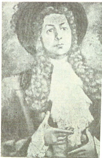
Arnolphe (Școala femeilor), într-un portret semnat Magdalena Rădulescu...