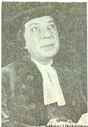
...și Tartuffe, în propria sa regie...