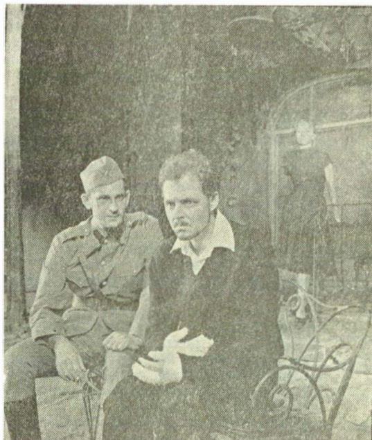
Moment dramatic din „Passacaglia“ de Titus Popovici, la Teatrul „Bulandra“

Dramaturgia actuală a demonstrat, din primele momente ale orientării ei revoluționare, preocuparea pentru afirmarea valorii umane, într-un nou climat etic și politic. Într-un proces de autoverificare a comportamentului individual, prin confruntarea principiului cu realitatea, piesa contemporană a făcut loc eticului ,