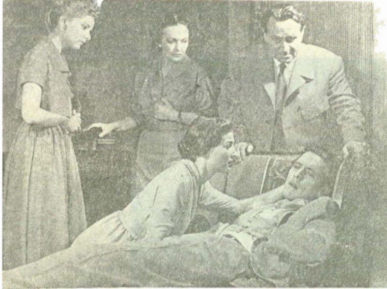
Scenă din „Surorile Boga“ de Horia Lovinescu, la Teatrul Național din București

Piesele din repertoriul românesc înregistrează pulsul realității în diferitele etape ale instaurării democrației socialiste. Nu pot fi perimate dramele al căror interes moral e viu și actual, care păstrează fiorul momentelor eroice dintr-un trecut apropiat. Dacă Simfonia patetică de Aurel Baranga reînvie imaginea terifiantă a regimului militar fascist, ajuns în ultimul său stadiu, Surorile Boga de Horia Lovinescu surprinde nu numai înfruntarea dintre detașamentele de muncitori înarmați și armata nazistă în retragere, ci și începutul procesului de transformare spirituală a maselor, care, prin exemplul acțiunii comunistilor descoperă un sens nou vieții. Expresivă e — din acest unghi de vedere — și drama cu structură de poem liric a lui Titus Popovici, Passacaglia , în care — după cumplita experiență a ocupației naziste — se înfiripă o atmosferă regeneratoare. Trilogia Oameni în luptă de Al. Voitiin emană sentimentul reconfortant al forței morale a luptătorilor comunisti, începând cu anii rezistenței ( Oameni care tac — exponent, comunistul Axinte) și pînă la actul justițiar din Ancheta .