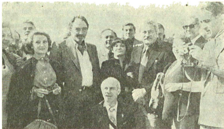
Clasica imagine- amintire, la Poiana Brașov

Despre ce ne vorbeau, in fond, acești școlari cu părul încărunțit, acești premianți cu tremolo-uri in glas, cu „bilbe“ incredibile și — mai ades — cu o lacrimă in ochi ? Despre o școală cu profesori minunați și cu intimplări intrate in legendă,