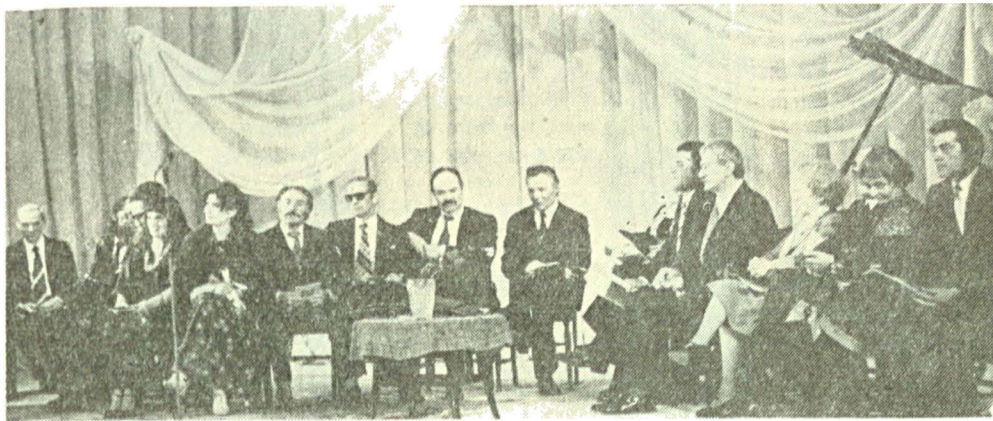
Toată lumea, pe scenă...