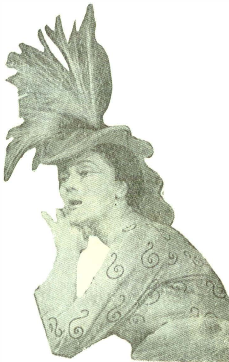
...și un divertisment teatral (Văduva, Ocolul pămîntului în 80 de zile, Pavel Kohout, după Jules Verne)