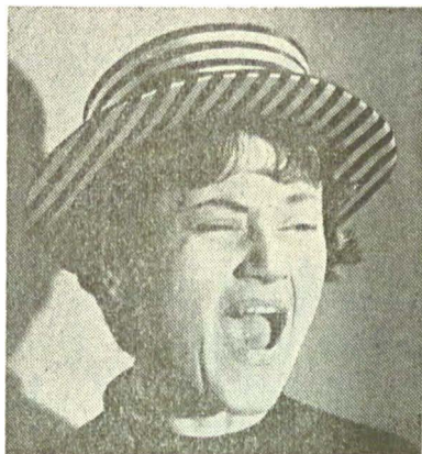
„Cap de expresie“ din 5 schițe de Caragiale : revelația unui exploziv talent comic