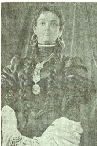
Contrast: Mașa (Cadavrul viu de Tolstoi), intruchipare a Ispitel...