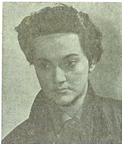
...și Femela-comisar (Tragedia optimistă, Vs. Vișnevski)