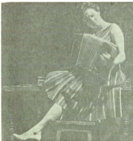
„Nila toboșara“ (A. Salinski), rol decisiv, în care o inteligență suplă la în stăpînire un temperament dramatic tumultuos...