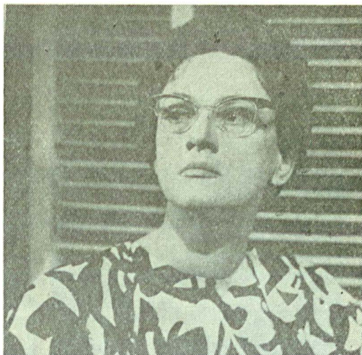
...și trufașa, calculata Regina (Vulpile, Lillian Hellman)