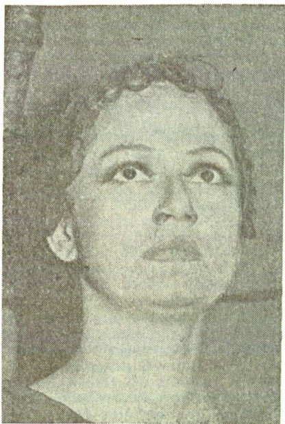
...in epoca eroinelor însetate de absolut : Antigona (Sofocle)...