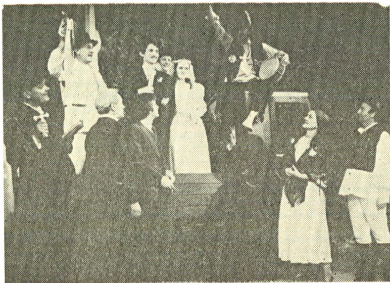
„Studiul osteologic...” de D. R. Popescu, Teatrul Naţional din Timişoara

Aceste valori şi posibilităţi artistice aparţin unei literaturi inspirate de o realitate dinamică, de raporturile dintre individ şi istorie, de procesul transformării relaţiilor dintre indivizi, de afirmarea în practică a idealurilor umanismului socialist. Literatura noastră dramatică contemporană se caracterizează prin abordarea problematicii sociale din trecutul apropiat şi din prezent, printr-o sensibilitate accentuată faţă de valenţele umane ale proceselor istorice, prin complexitatea şi contemporaneitatea mesajului, prin aderenţa faţă de problemele obştii. Scriitorul credincios profesiei sale de credinţă analizează şi cîntăreşte cu simţ de răspundere legităţile realităţii şi doreşte să-l ajute, prin mijloacele specifice de care dispune, pe spectatorul contemporan, pentru a-l incita la meditaţie asupra realităţii. Operele dramatice exprimă procesul complex al devenirii raporturilor interumane, străduindu-se să schiţeze profilul spiritual şi moral al omului-participant activ la prefacerile revoluţionare ; ele întreprind o critică socială decisă, în numele şi în interesul a ceea ce este uman în om, exprimînd o viziune istorico-filozofică naţională modernă. Modulurile de abordare, genurile, instrumentele înfăţişării artistice sînt, bineînţeles, diferite ; la fel, puterea de generalizare şi acoperirea în realitate a viziunilor scriitoriceşti, exprimate în compunerea situaţiilor şi a caracterelor, diferă ; dar, angajarea scriitoricească, rădăcinile aspira-