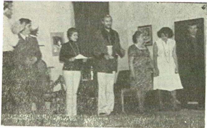
Teatrul popular al Casei de cultură a orașului Slănic-Prahova: „Chemarea” de Cristian Munteanu