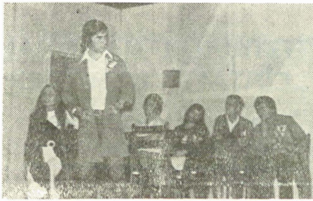
Teatrul popular al Intreprinderii de mecanică Ploeni-Prahova : „Omul nu-i supus mașinii” de Tudor Popescu