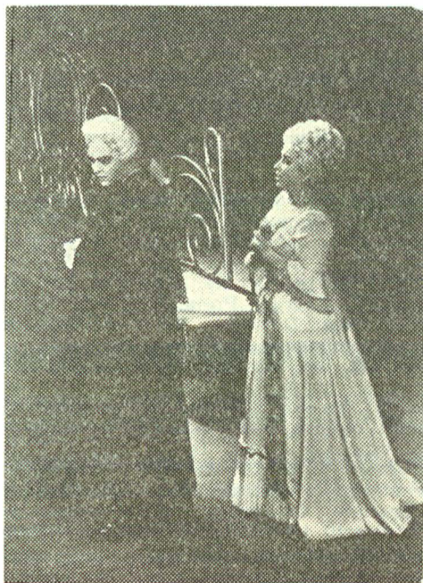
Scenă din „Dama de pică“

Înainte de orice, o orchestră ce poate rivaliza cu multe filarmonici de renume — și a și făcut-o, interpretînd admirabil, într-un concert la Sala Mare a Palatului R.S.R., fantezia simfonică Romeo și Julieta , de Ceaikovski. Explicația înaltei calități a ansamblului? Valoarea fiecărui instrumentist în parte (dintre ei, unii