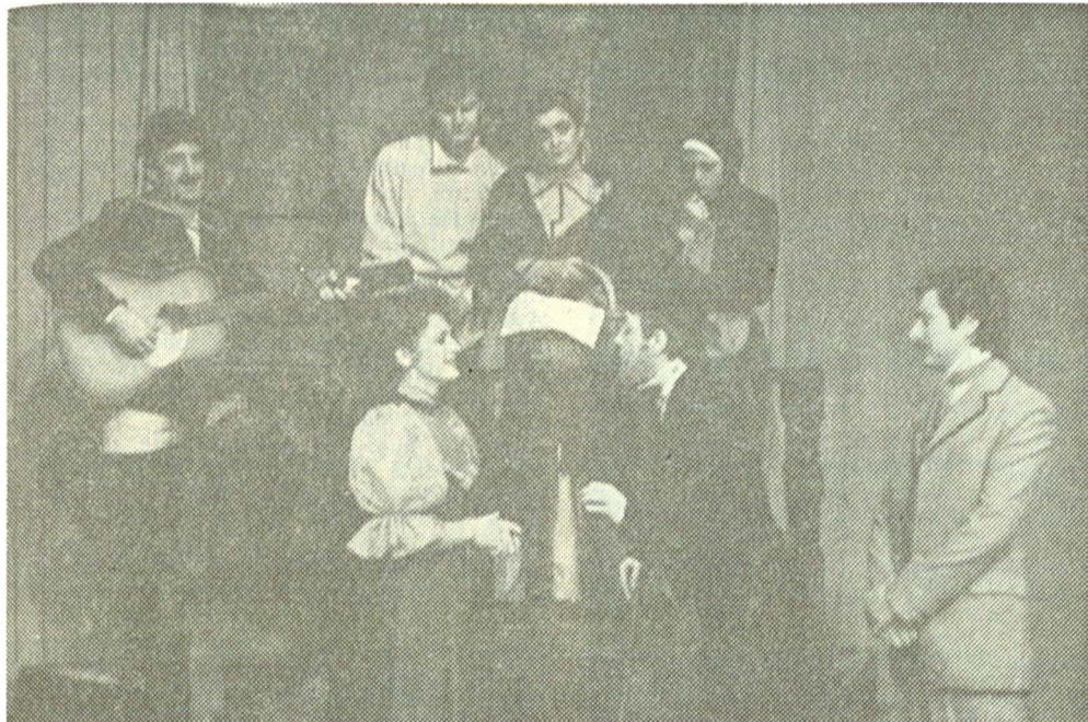
Scenă din „Pescărușul”