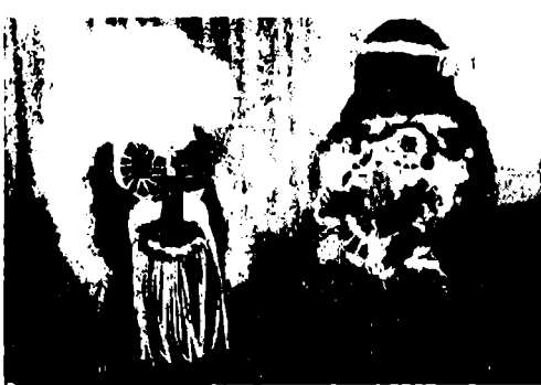
Măști din spectacolul „Prostia omenească”