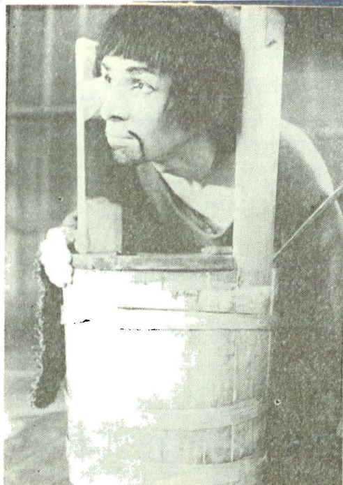
În rolul sacagiului Vang din „Omul cel bun din Siciuan“ de Brecht, la Teatrul Tineretului din Piatra Neamț

— Experiența de la Piatra Neamț a însemnat o școală pentru mine. Acolo am aflat că spectacolul e un tot și fiecare compartiment trebuie să fie servit cu aceeași ardere, totul trebuie să funcționeze perfect, ca într-un angrenaj în care fiecare roțiță e importantă. Am învățat lucrul acesta de la mari regizori, și îmi amintesc totdeauna cu nostalgie de perioada lucrului la Woyzeck , cînd ni se crea posibilitatea de a improviza, eram lăsați să ajungem singuri la adevărul personajelor, și lucrul acesta ne convenea de minune. Am învățat atunci și cum să ne privim colegii, dacă vă mai amintiți,