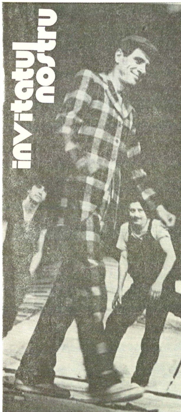
În rolul diavolului Koroviev, din „Maestrul și Margareta”, după Mihail Bulgakov, la Teatrul Mic