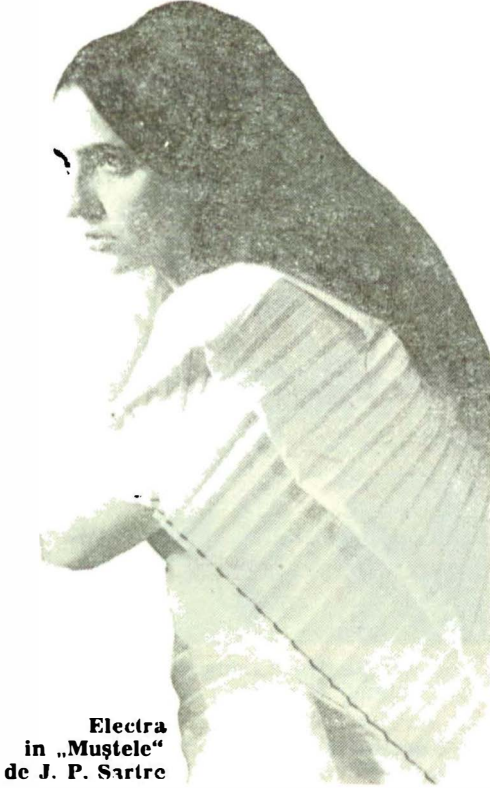
Electra în „Muștele” de J. P. Sartre