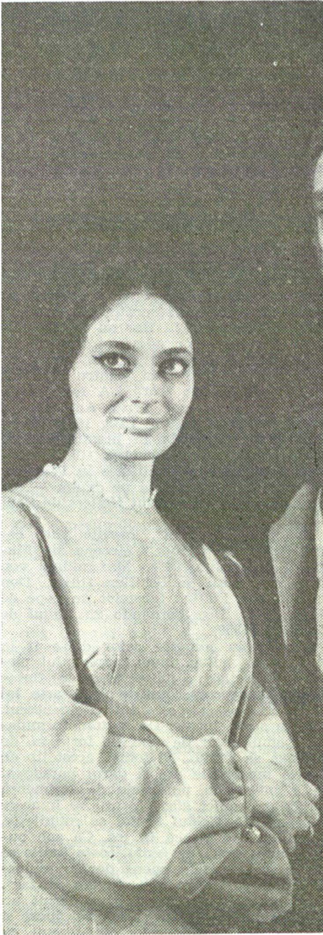
In „Constructorul Solness“ de Ibsen