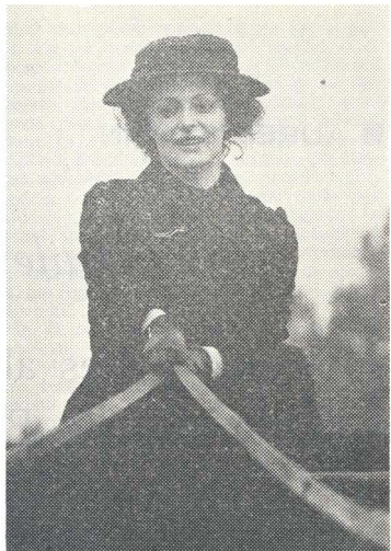
În „Bohemia, destinul meu” serial TV realizat de televiziunea din R.D.G.

— Spune-mi cum vrei, știi tu cum se răspunde la urări, în teatru. Dar să fie cum zici tu.