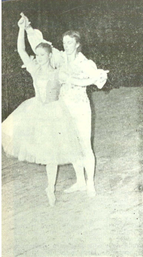
Dansul clasic academic din Pre-cauțiuni inutile