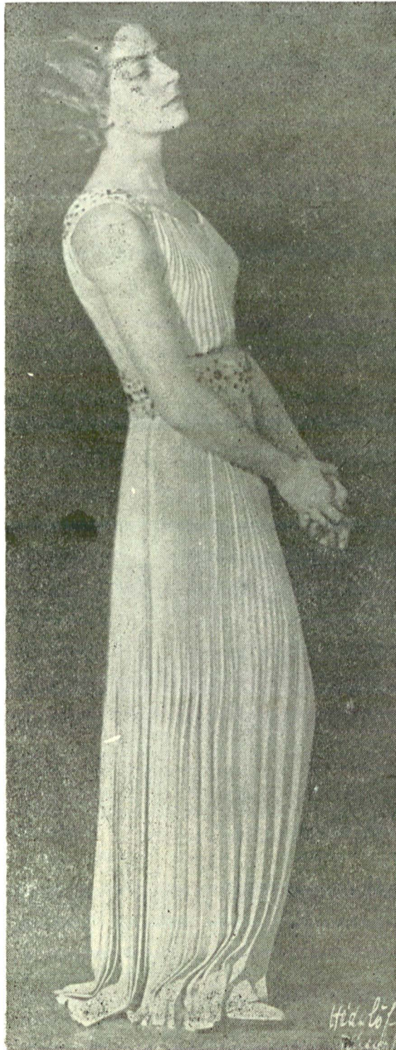
La Compania Bulandra, in Éspoir de Henri Iernstein