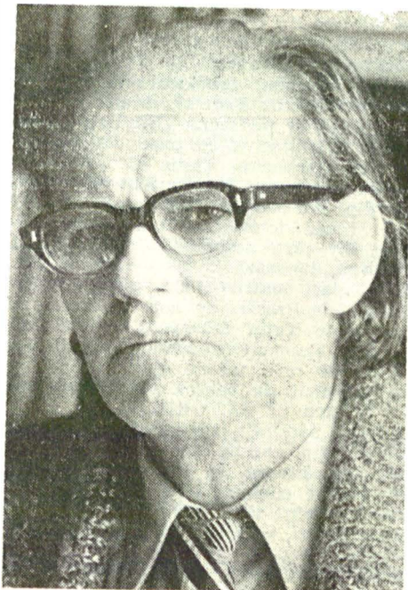
Dramaturgul și poetul Ivan Radoev

die, este de luat în seamă și de reținut. Întrebarea pe care o punem este dacă în Bulgaria există din start tendința ca actorul să încerce să se realizeze pe mai multe planuri de expresie (comedie, tragedie).