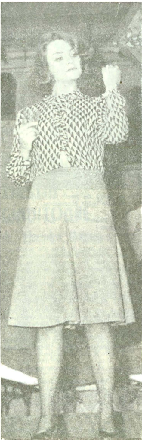
La prima întâlnire cu Silvia din „Acești îngeri triști” de Dumitru Radu Popescu : în Institut, la examenul de absolvire...