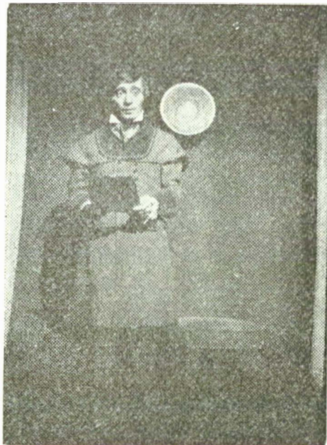
Sub aparenţa timidităţii, o deplină stăpînire de sine — Mesagerul în „Culorile nemuririi” de Ştefan Tita

— Vă mulţumesc pentru frumoasa „panoramare” a carierei mele! În ce priveşte experienţele din cinematografie, nu au fost roluri de întindere, dar le-am lucrat cu mîgălă, şi, de ce să nu spun, avînd satisfacţia de a mă afla în preajma unor mari actori. Am interpretat pe „soldatul cu ochelari” în Prea mic pentru un război atît de mare , m-am amuzat să schiţez profilul unui pictor dadaist în Actorul şi sălbăticiu ; în primul serial al televiziunii române, Un august în flăcări , am fost un utecist, iar în