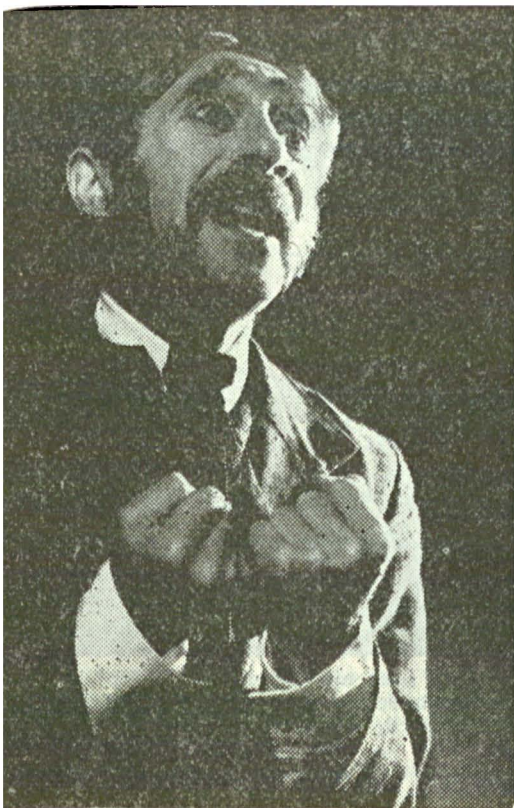
Neînțelegind răutățile oamenilor din jurul său — Muniș, eroul lui Perciz