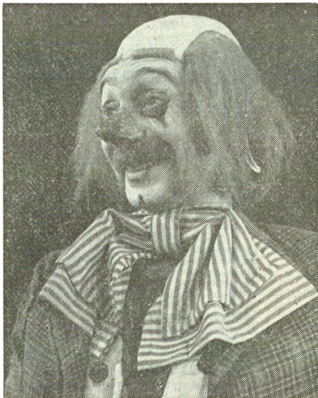
Simbol al mersului înainte al lumii, cirearul Poly din „Cel care primește palme” de Leonid Andreev