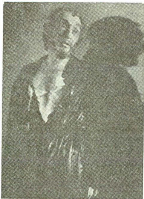
Tanhum — maximă transfigurare într-un poem al condiţiei umane: „Golem” de A. Leivik