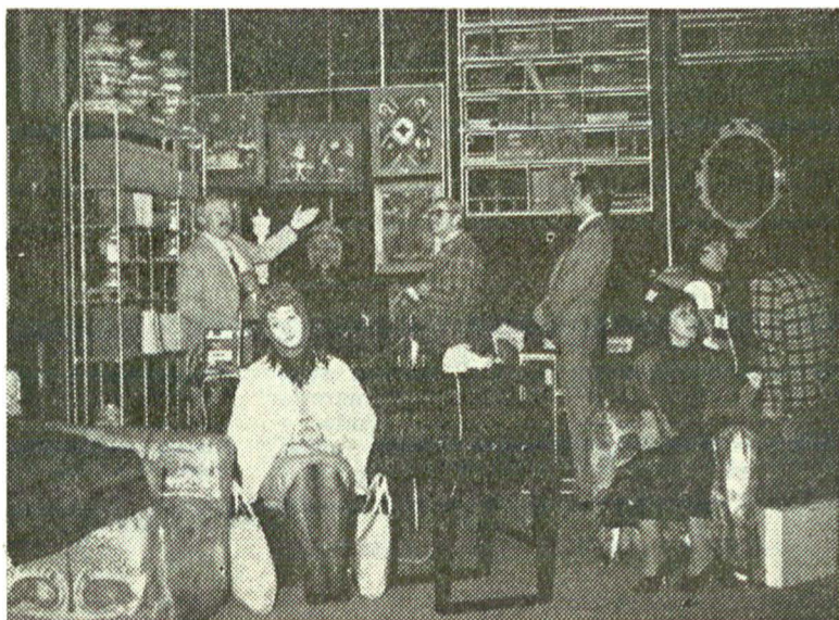
„Turnul de fildeş“ de Viktor Rozov

— Studioul te duce cu gândul la experiment și, personal, sală pentru experiment nu mi se pare potrivit. A experimenta este o chestiune de meserie, adică subînțeleasă, indiferent de mărimea și forma spațiului de joc. Gustul se schimbă repede, sub raportul mijloacelor de expresie, și cine nu experimentează înseamnă că nu e profesionist. De aceea, a numi a doua