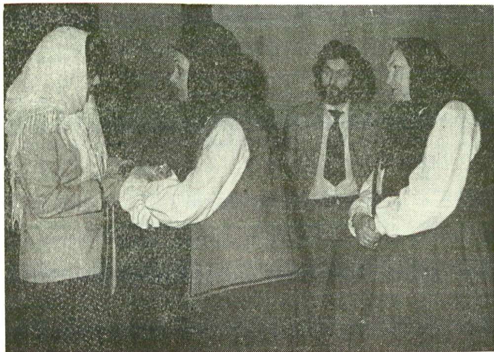
„Primăvara eroului“ de Emil Poenaru