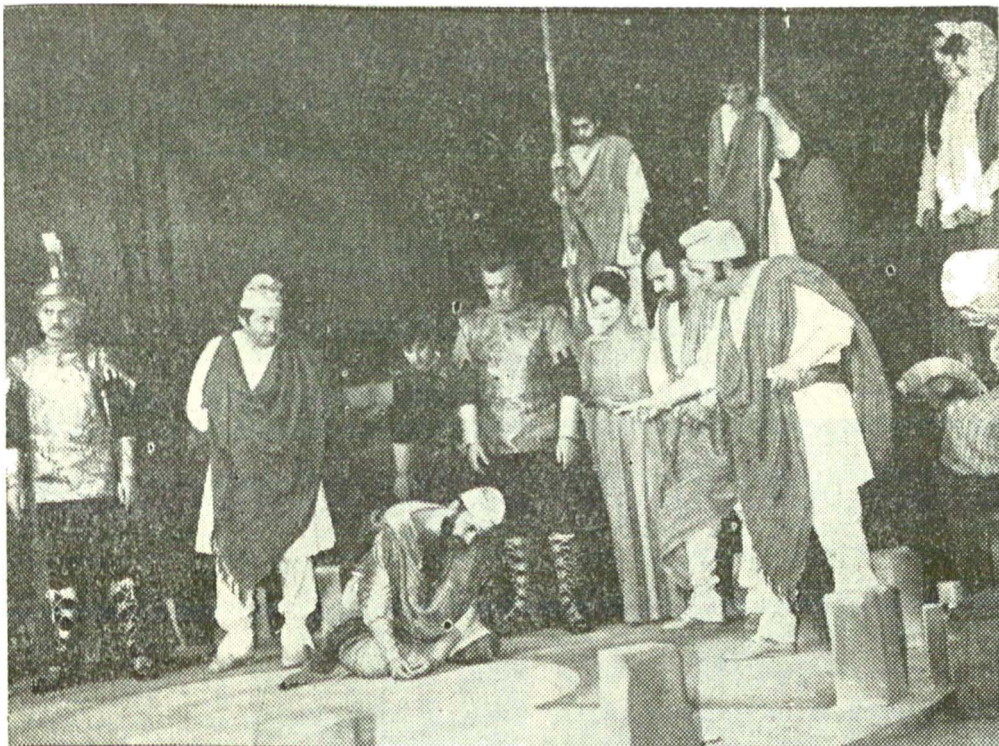
Scenă din „Muntele“ de D. R. Popescu