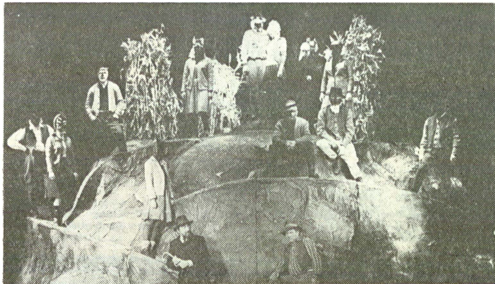
„Bocet vesel pentru un fir de praf rătăclitor“ de Sütő András, în montarea trupei maghiare a Teatrului Național din Tirgu Mureș

dialogul. În sens propriu sau figurat, deopotrivă.