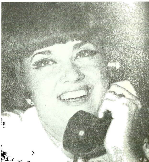
Plină de vervă într-o comedie polițistă de succes, „Martorii se suprimă” de Robert Thomas