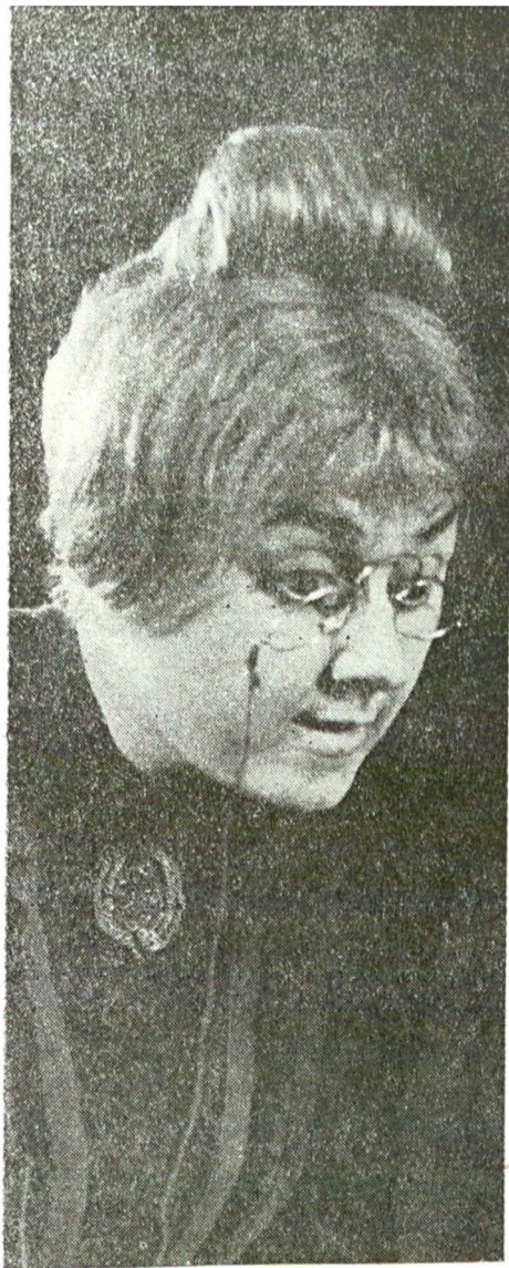
O reușită compoziție timpurie : una dintre „gaițele” lui Kirilțescu