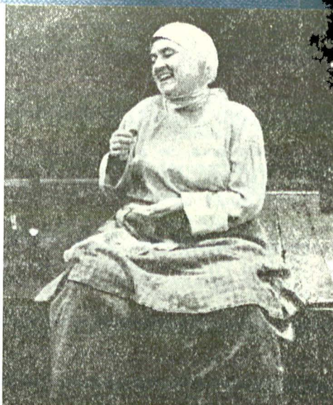
Apărentă bonomie, senzuală ferocitate — Kvașnia din „Azilul de noapte“ în regia lui Liviu Ciutei