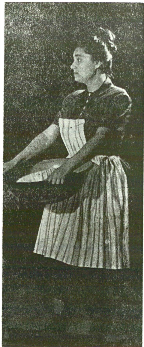
Inocența și candoarea începuturilor — în „Domnul Puntila și sluga sa Matti” de Brecht

geraș, după ce lumea mă aplaudase, tata, în culise, mi-a spus și el „bravo” și m-a întrebat repede : „Ce vrei tu să te faci ?” Eu am răspuns : „Artistă !” Și, după o clipă : „Parcă și doctoriță”. Peste ani, la Iași, m-am înscris și la Facultatea de medicină, dar a trebuit să renunț, pentru că nu puteam face față la cursurile de zi ale Institutului. Mi-a prins totuși bine acel început de experiență ; am simțit încă de atunci că actorul trebuie să aibă suflet bun, ca și medicul adevărat.