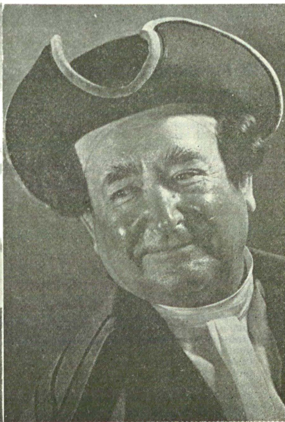
In „Bădăranii” de Carlo Goldoni