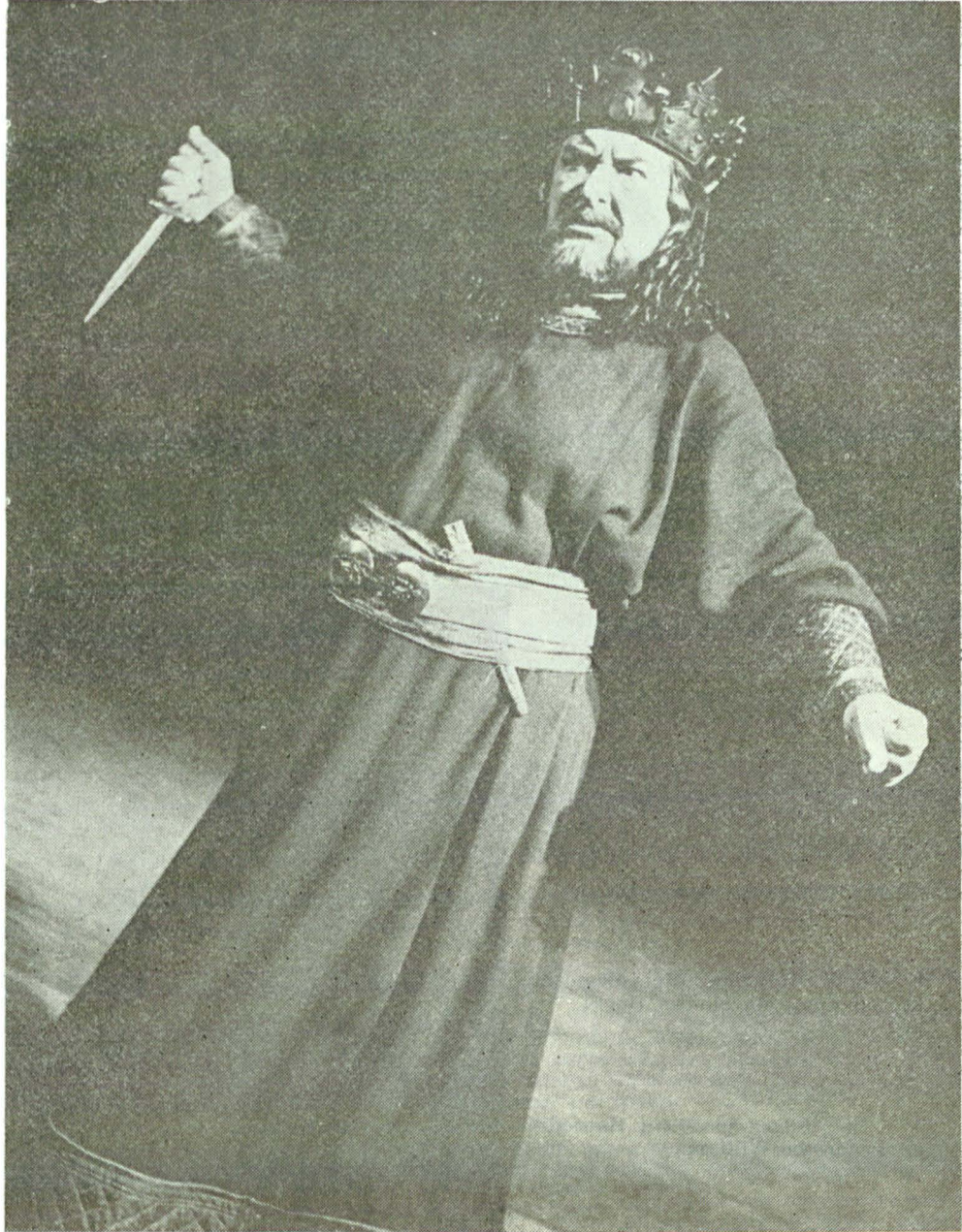
În „Vlăicu Vodă” de A. Dăvilă

Nu mi-am propus să-i trec în revistă palmaresul artistic, rolurile, citatele din cronici. A fost și este pentru mine — de totdeauna — Ștefan cel Mare. Nu-mi pot imagina Delavrancea fără Calboreanu. Nici invers. Să vă povestesc.