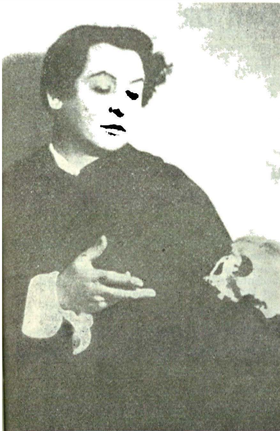
In „Hamlet” de Shakespeare