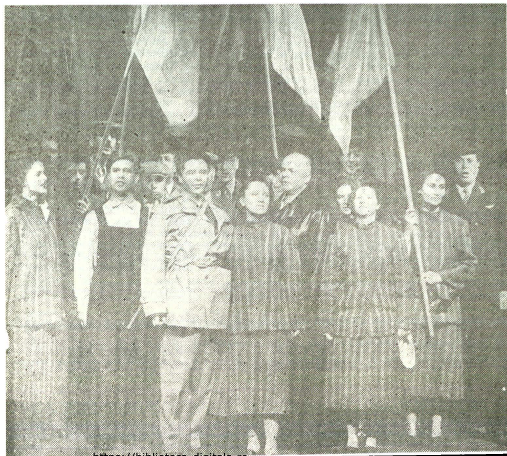
Scena finală din „Marele fluviu își adună apele” de Dan Tărchiță