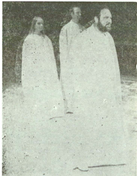
Trei eroi shakespeareni : Lear... ...și Prospero