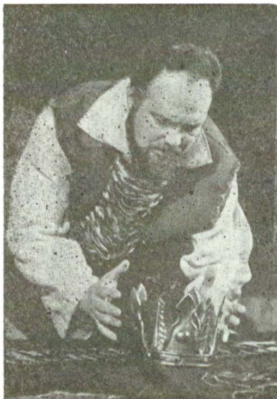
Petru Rareș din piesa cu același nume de Horia Lovinescu

În „Omul care și-a pierdut omenia” de Horia Lovinescu