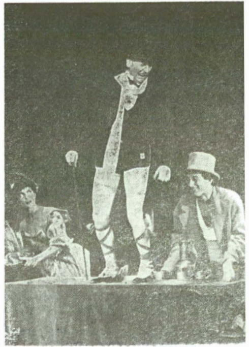
Malvolio din „A douăsprezecea noapte” de Shakespeare

În artă de excepție! E nevoie aici de o potrivire de talent între regizor și actor. De talent, de intelect, de ținută și, cum se spune cu fervoare crescîndă, de program.