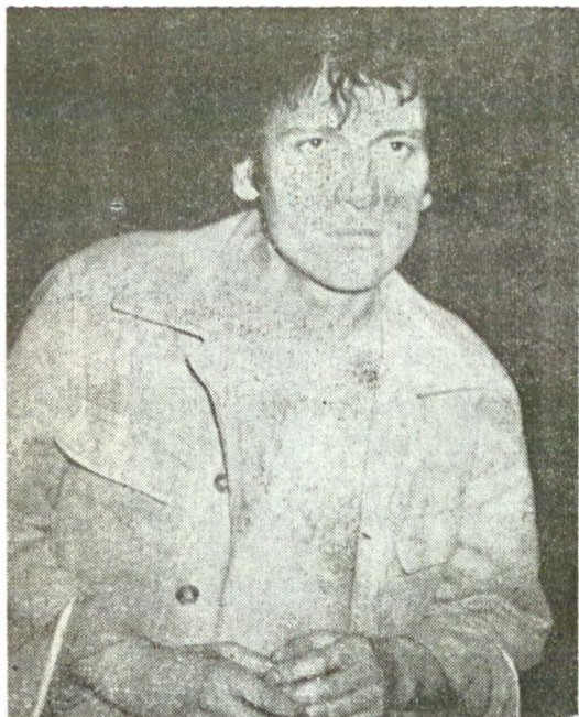
Oswald din „Regele Lear“ de Shakespeare — rolul de debut pe scena Naționalului bucureștean