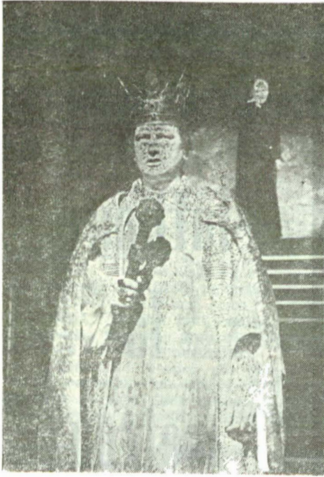
În „Despot-Vodă” de Vasile Alecsandri