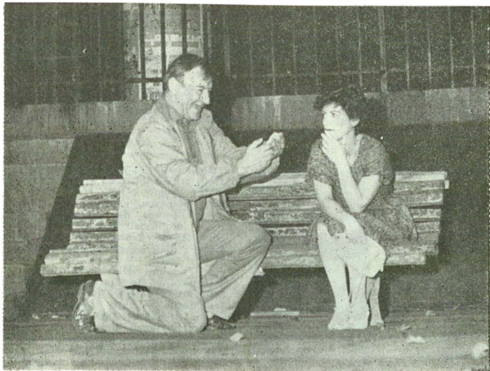
Cu Victor Rebengiuc în piesa „Într-un parc pe o bancă” de Aleksandr Ghelman

— Cred că așa ar fi bine. Orice trăire pe scenă ar trebui supravegheată. De fapt, în sinea ta, știi tot timpul cum ești.