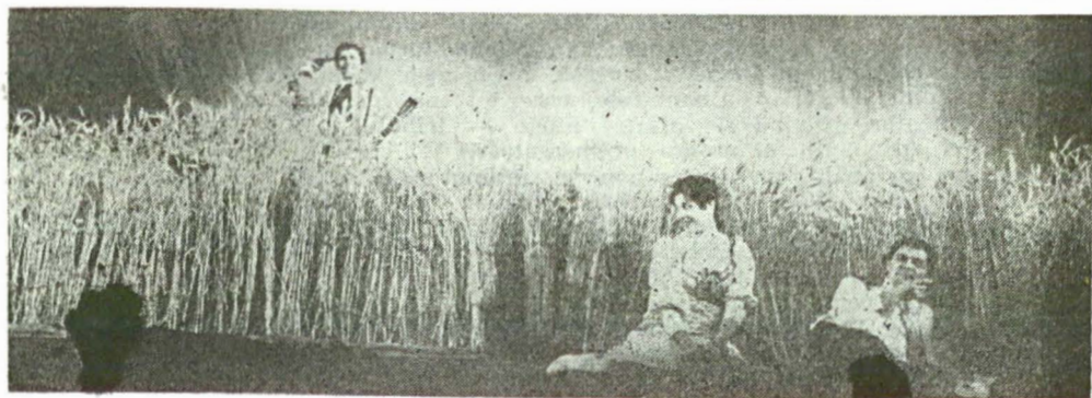
Teatrul „Bulandra” : O scrisoare pierdută de I. L. Caragiale (1972), regia Liviu Ciulei..