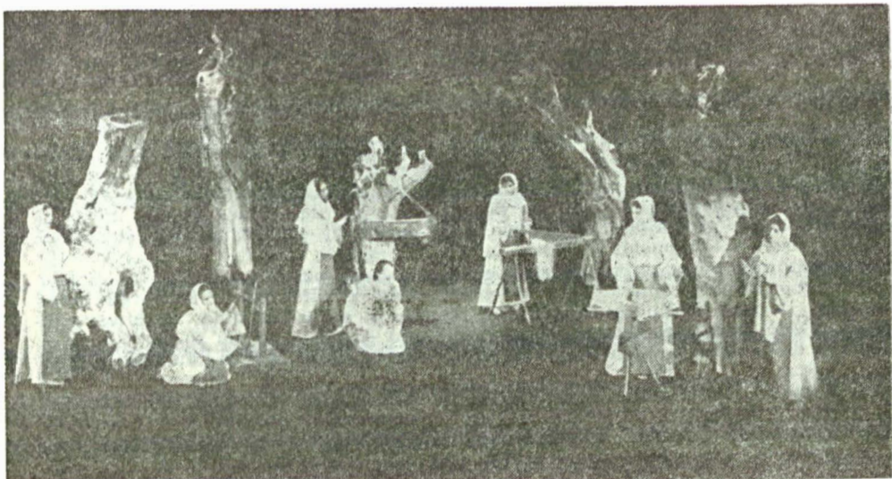
Teatrul Tineretului din Piatra Neamț : Tinerețe fără bătrânețe de Eduard Covali (1975), regia Cătălina Buzoianu

Teatrul Giulești : Descăpătinaarea de Al. Sever (1977), regia Tudor Mărăscu