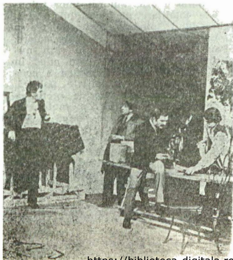
Teatrul Național din București : Un fluture pe lampă de Paul Everac (1972), regia Horea Popescu