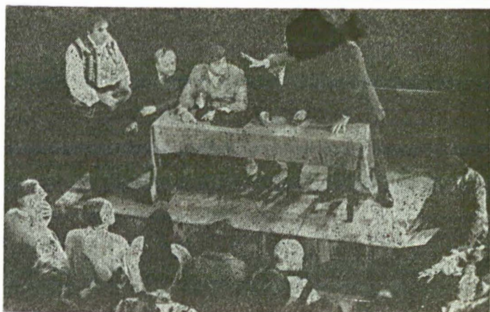
...și Puterea și Adevărul de Titus Popovici (1973), regia Liviu Ciulei