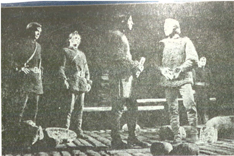
Teatrul Național din București Săptămîna patimilor de Paul Anghel (1971), regia George Teodorescu