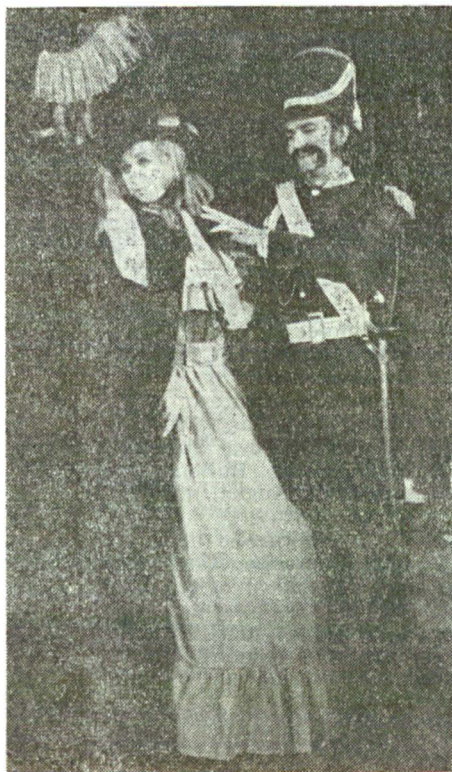
Teatrul Național „Vasile Alecsandri” din Iași : Iașii în carnaval (1972), regia Cătălina Buzolanu