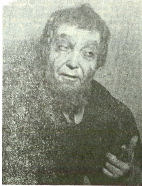
Roluri din Shakespeare : Întiul gropar din „Hamlet“