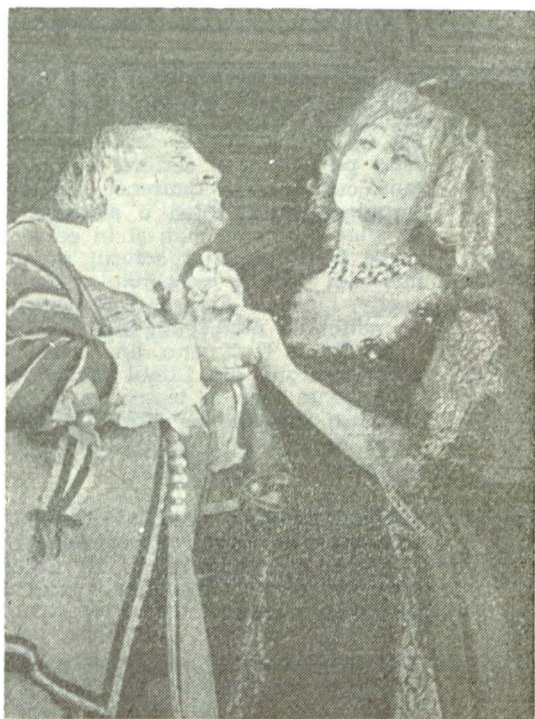
Roxana, în „Cyrano de Bergerac” de Edmond Rostand, alături de C. Guriță

ximilian, Ramadan, Vrăca... Se vina rolul și prim-planul cu o fervoare... Tinerii noștri colegi sînt mai dispuși să cedeze în favoarea întregului, să facă împreună spectacolul, sînt mai buni coechipieri. Or, teatrul este o artă colectivă, nu ?