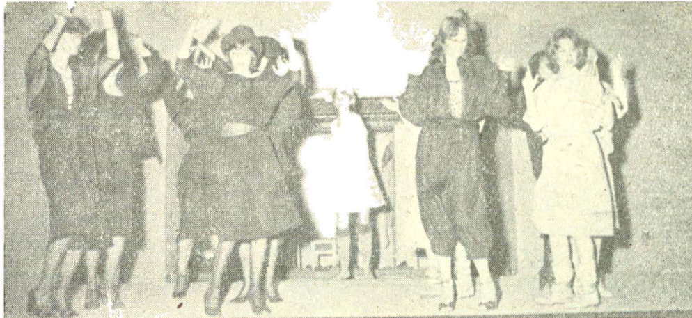
Două scene din spectacolul „O dragoste nebună, nebună, nebună” de Tudor Popescu, la Teatrul Național din Timișoara. Regia, Ioan Ieremia