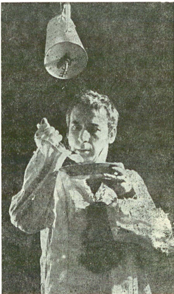
Poprișcin — Jurnalul unui nebun de Gogol

Mă opresc aici. Nu înainte de a sublinia că la Galați, unde am stat cele mai multe stagioni, mă simt foarte bine în