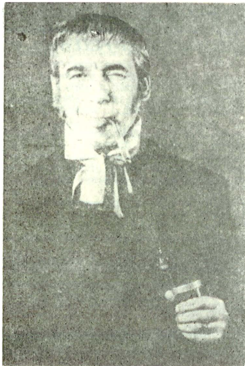
Jevakin — Căsătoria de Gogol

cu (Micul Infern) de Mircea Ștefănescu, Ionescu Novus ( Gimnastică sentimentală de V. Voiculescu), Decebal („Escu de T. Mușatescu), Fiorelo ( Dona Juana de Radu Stanca), Nate ( Punctul culminant de Gh. Vlăd), Valentin ( Simbătă la Veritas de M. R. Jacoban), Bebe Valsamache ( Sicliana de A. Baranga), Măilat ( Singele ), Dinu ( O casă onorabilă de H. Lovinescu), Maiorul ( Acum și-n cele din urmă de Th. Mănescu) — din dramaturgia românească; Arlechino ( Mîncinosul de Goldoni), Speed ( Doi tineri din Verona de Shakespeare), Topaze (eroul piesei lui Marcel Pagnol), Don Perlimplin ( Dragostea lui Don Perlimplin de Garcia Lorca), Burgoyne ( Discipolul diavolului de G. B. Shaw), Fred ( Mașina de scris de J. Cocteau), Frank al V-lea (din piesa omonimă de Dürrenmatt), Jevakin ( Căsătoria ) și Poprișcin ( Jurnalul unui nebun de Gogol) — din dramaturgia universală sînt doar o parte dintre cele jucate. Parafrazîndu-l pe Figaro, aș spune: „Trebuie să ne bucurăm că trăim și să trăim pentru a ne bucura“.