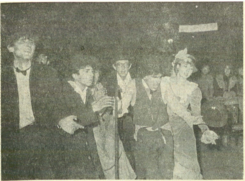
„Fintina III” — colaj prezentat de Studioul de caragialeologie din Timișoara